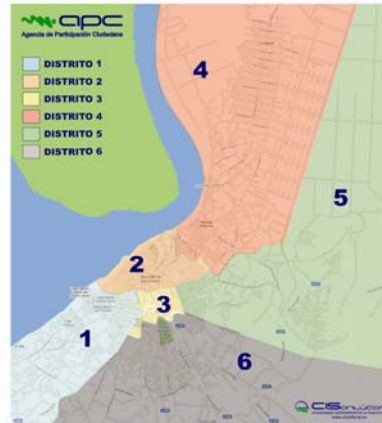
Diagrama de Trabajo